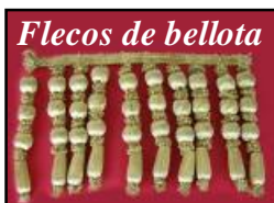
Flecos de bellota

FALDÓN: Telas que se colocan alrededor del paso para su adorno y resguardo del frío a los costaleros.